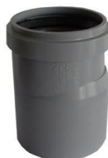
art. CRO7600 HT přechodka do hrdla PP/PVC 75/63