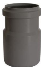
art. CRO6500 HT přechodka do hrdla PP/PVC 50/63