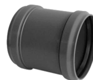
art. CN60000 HT PVC nátrubek 63